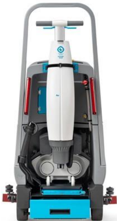
i-drive + imop Lite