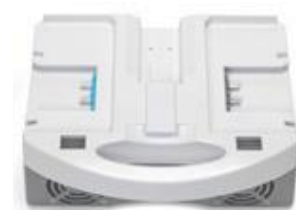
i-charge 9 (3 unidades)