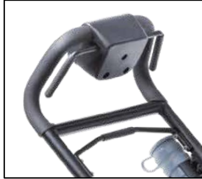
Parada rápida (Quick stop) de serie