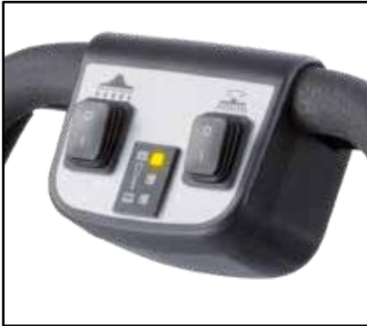
Panel de control intuitivo