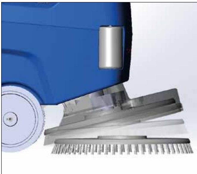
Rápido y limpio: la colocación automática del cepillo